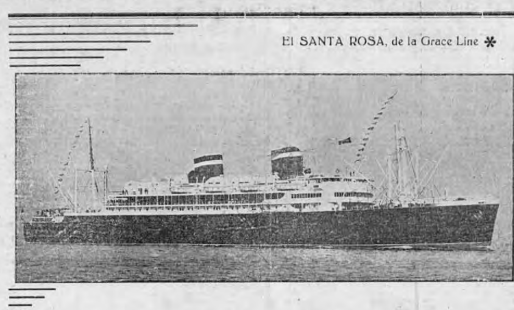
El SANTA ROSA, de la Grace Line *

...doquier, Pabco! En bancos, edificios públicos, iglesias, etc. Siempre, cuando se desea o requiere buena pintura, los entendidos la prefieren.— * El "Santa Rosa" es uno de los barcos en que precisamente los productos Pabco son traídos a estas partes de América. El casco de ese nuevo y hermoso buque fué pintado con una de las calidades superiores Pabco, el esmalte Cin-dek. PINTURAS PABCO — LISELAS LTD. TAMBIEN Almacén KOBERG