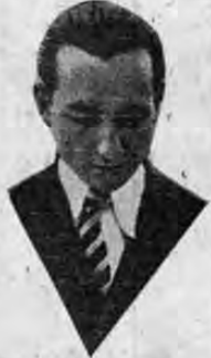
EL AVIADOR POMBO

LA TRIBUNA se anotó un nuevo triunfo informativo al dar a conocer a todo el país este lamentable suceso.