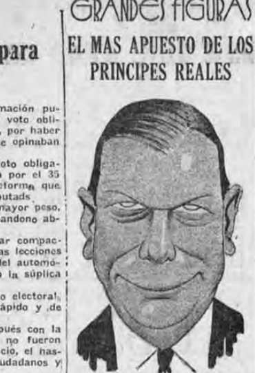
DUQUE DE KENT

El duque de Kent es el mejor amigo del príncipe de Gales, pero empieza a ser su rival. El cable nos anunció en los primeros días de mayo, que había lanzado dos modas que prendieron rápidamente en la juventud elegante británica y continental: la camisa inmaculadamente blanca, después de tantas fantasías de colores, y el saco cruzado, abrochado sólo del botón de abajo, de manera que deja una amplia y larga vuelta flexible a las solapas. Ya lo saben nuestros elegantes.